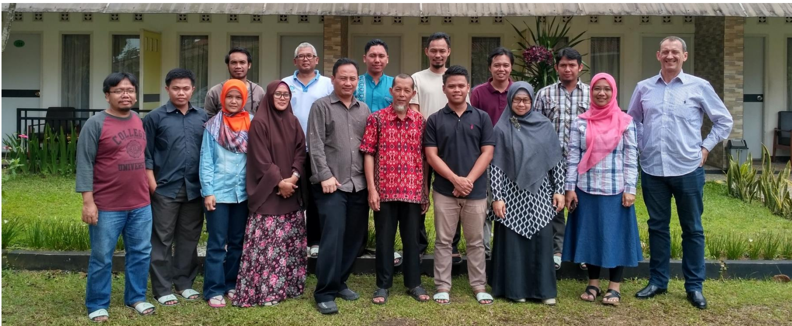
Foto bersama Tim Penulis Dokumen SEHATI Sumsel dan Tim Fasilitator dari IPB usai acara pembukaan

GIZ BIOCLIME bekerjasama dengan Pemerintah Daerah Sumatera Selatan dalam hal ini Bappeda dan Dinas Kehutanan Sumatera Selatan akan mendukung proses penyusunan dokumen Strategi dan Rencana Aksi Keanekaragaman Hayati Sumatera Selatan. Beberapa tahapan program untuk pelaksanaan rencana aksi IBSAP di tingkat lokal seperti (i) penyusunan data dan informasi kehati lokal; (ii) penyusunan kebijakan, strategi dan rencana aksi pemeliharaan & pelestarian kehati lokal; dan (iii) rencana aksi peningkatan kapasitas dan kelembagaan pengelola kehati. Proses penyusunan dokumen Strategi dan Rencana Aksi Keanekaragaman Hayati Sumatera Selatan telah melewati beberapa proses diantaranya: kick-off meeting , diskusi kelompok terarah/ focus group discussion (FGD) tentang pengumpulan data dasar kehati, FGD identifikasi Program, Strategi dan Rencana Aksi Kehati dan pembahasan draft-2 dan draft-1 dokumen. Untuk selanjutnya, tim kelompok kerja telah melaksanakan pertemuan berikutnya untuk membahas dan memfinalisasi draft 0 dokumen Strategi dan Rencana Aksi Kehati Sumatera Selatan serta rencana tindak lanjut konsultasi publik.